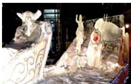
Maison des jeunes et de la culture