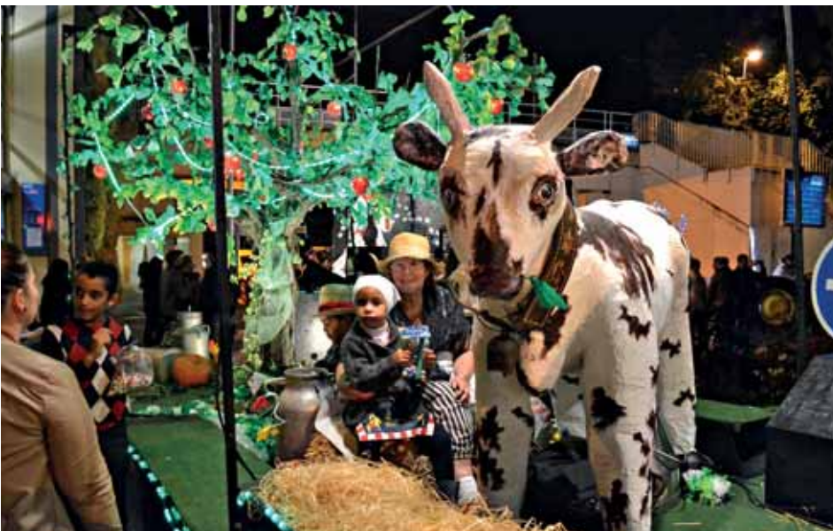
L'Ass des fêtes