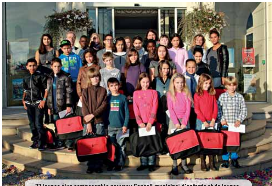
37 jeunes élus composent le nouveau Conseil municipal d'enfants et de jeunes.

SAMEDI 12 OCTOBRE DERNIER, 37 JEUNES ERMONTOIS ONT ÉTÉ ÉLUS AU CONSEIL MUNICIPAL D'ENFANTS ET DE JEUNES POUR UN MANDAT DE DEUX ANS.