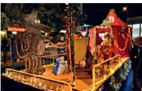
Association éducative des Chênes